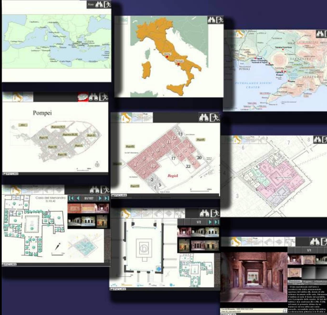
L'interfaccia navigabile TopViewer