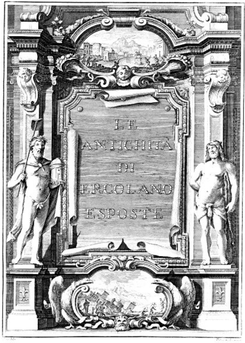
Le Antichità di Ercolano esposte (1757- 1792) Thumbnails index